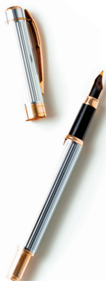
Anna Zalewska Minister Edukacji Narodowej Warszawa, 1 września 2017 r.

Fundacja „Rodzice Szkole” adres do korespondencji: ul. Marii Kazimiery 20 lok. 5 01-641 Warszawa e-mail: kontakt@rodziceszkole.edu.pl